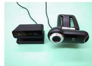
図 1 使用した Web カメラ

b 可動域が限られている本児の指先に合わせて自作したスイッチ熱変形プラスチックで指の型を採り、その上に小型のリーフスイッチを接着したもの。親指で押して操作する。本実践以前から活用してきている。